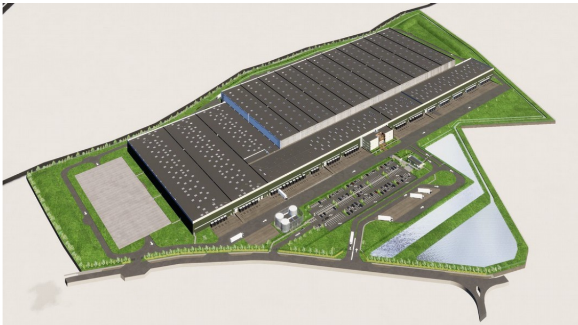
Figure 2: Vue du futur entrepôt (dossier du porteur de projet)