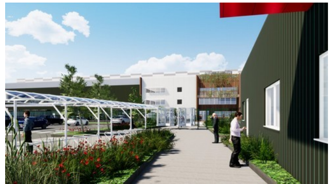
Figure 3: vues de l'extérieur du bâtiment entrepôt

Concernant l'aménagement extérieur dans le site, des écrans visuels seront composés d'une ligne d'arbres de haute tige (chênes, châtaigniers, ormes) doublée d'une ligne basse composée d'arbustes. Un arbre de haute tige sera planté pour 100 m 2 d'espace libre, soit environ 500 arbres.